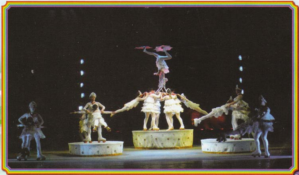
สาวน้อยกับสเก็ตระทึบใจ