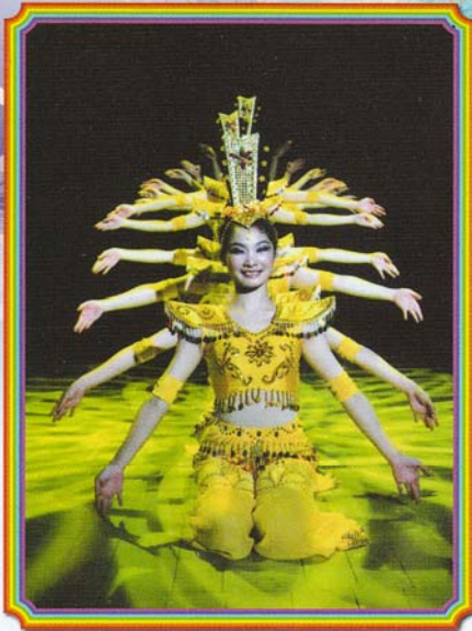
กวนอิมพันมือ