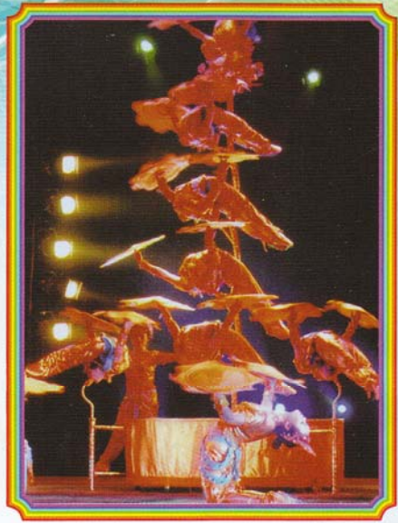
สาวพลังเท้ามหัศจรรย์