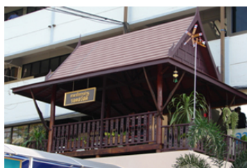
ศาลารับการอ่าน สำหรับ นักเรียน ใช้อ่านหนังสือในยามว่าง