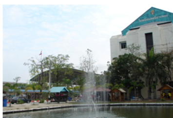
ศาลาพักผ่อน รอบสระน้ำ ช่วยให้นักเรียนผ่อนคลายจากการเรียน