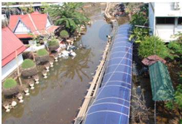
สภาพโรงเรียนขณะประสบอุทกภัย

โรงเรียนสตรีอ่างทอง ขอกราบขอบพระคุณทุกท่านที่มีส่วนร่วมในการพัฒนาโรงเรียนให้มีสภาพแวดล้อมที่ดีขึ้นตามที่ปรากฏในปัจจุบันนี้