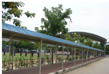
ทางเดินเข้าโรงเรียน กันแดด กันฝน เช่นกัน