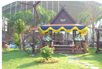
ศาลาพักผ่อน แหล่งการเรียนรู้ด้านความคิดคำนวณ