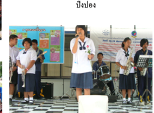
วงดนตรีของโรงเรียน