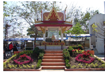
บรรยากาศและสิ่งแวดล้อมที่สวยงาม ทำให้ โรงเรียนสตรีอ่างทอง เป็นสถานศึกษาที่น่าอยู่ น่าเรียน