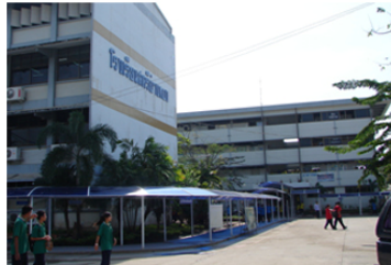
ทางเดินระหว่างอาคาร มีหลังคาเพื่อกันแดด กันฝน