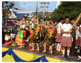
ดนตรี - นาฏศิลป์