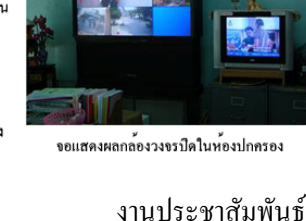
จอแสดงผลกล้องวงจรปิดในห้องปกครอง