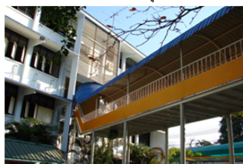
สะพานเชื่อมชั้นที่สองของอาคาร เพื่อลดเวลาในการเดินเรียน